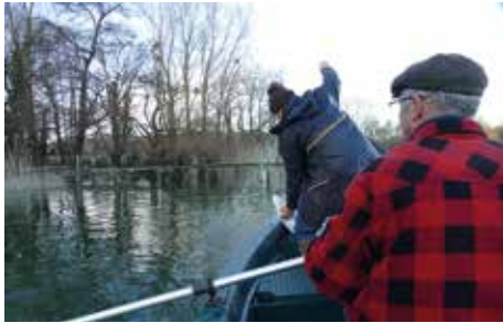
Pose d'un filet