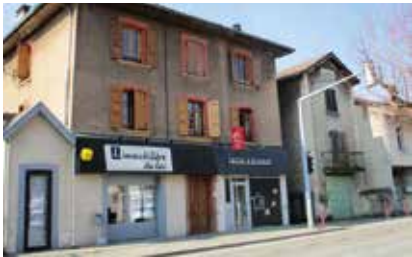
De petits immeubles en R+2 avec des surfaces d'activité au rez-de-chaussée, c'est le gabarit standard historique en centre bourg de Charavines.

La pression immobilière à Charavines se lit selon trois indicateurs :