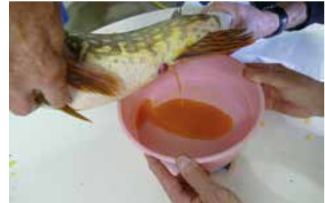
Récupération des ovules