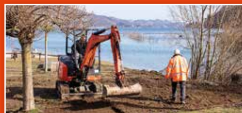
L'équipe des services technique sur le chantier de la plage.