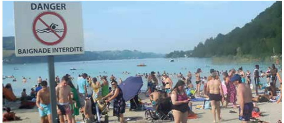
La plage est un site privilégié, pour les estivants mais aussi pour les habitants pour lesquels il s'agit d'un lieu de promenade et détente apprécié.

UN ENJEU QUI DÉPASSE LES LIMITES DE NOTRE SEULE COMMUNE !