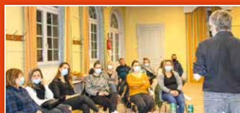
Rencontre avec les employés municipaux