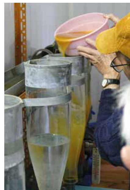
Mise en bouteille des œufs

la fécondation des œufs, on prélève les ovules par un massage du ventre puis on y ajoute la laitance récupérée sur plusieurs mâles. Les œufs ainsi fécondés sont ensuite placés dans de grandes bouteilles sans fond montées goulot en bas. Les brochets géniteurs sont ensuite relâchés. Dans leurs bouteilles, les œufs sont constamment agités par un flux d'eau de lac créé à l'aide d'une pompe électrique. Ils y restent jusqu'à l'éclosion des alevins. Ces derniers sont ensuite transférés dans de grands bacs. Là, pendant plusieurs jours, ils se posent sur des branches de sapin immergées jusqu'à ce qu'ils aient résorbé les réserves stockées dans leur vésicule vitelline. Lorsque les alevins commencent à s'agiter, c'est le signe qu'ils sont prêts à chasser leur propre nourriture. Ils sont alors lâchés dans le lac. Leur dissémination se fait au plus près des zones les plus favorables, notamment les roselières. Cet engagement dans la reproduction des brochets à l'écloserie de Colletière a permis d'élever et de relâcher environ 250 000 alevins de brochet depuis 2015.