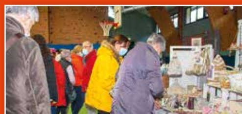
Autour du Fil, organisée par Anim'Chara