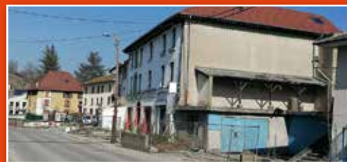
Abords de l'Hôtel de la Poste, un sujet qui mobilise le Conseil Municipal