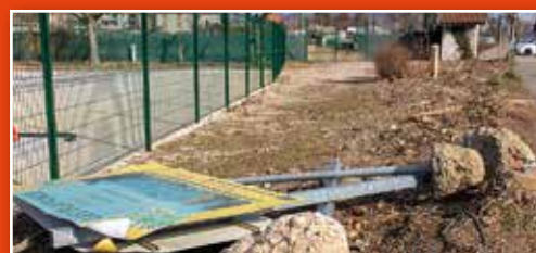
Chantiers en cours : abords de l'aire de camping car