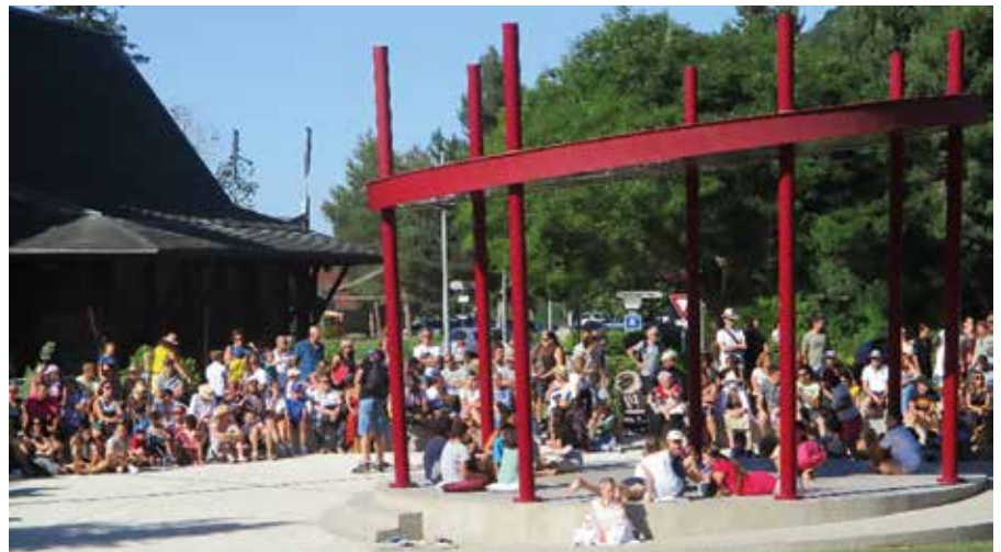
La Grange à Danser a investi le kiosque pour lancer sa belle "déambulation".

Le financement des projets est de plus en plus difficile, raison de plus pour valoriser les concours des partenaires qui accompagnent la commune. Ci-dessous un récapitulatif indicatif des subventions perçues par la commune pour ses principaux projets.