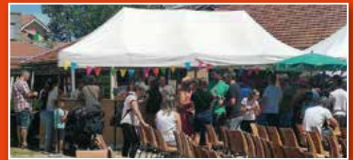
La fête de l'école publique.