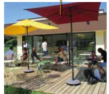
Le bâtiment Comptoir, déjà essentiel aux événements accueillis.