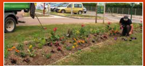
Notre service technique chouchoute les massifs fleuris de la commune.