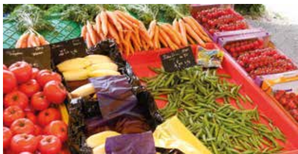
Nos sociétés occidentales ne sont plus habituées à vivre avec des craintes planant sur l'approvisionnement alimentaire.

Mais cela ne suffit pas. Ces choix individuels ne sont pas accessibles à tous. Beaucoup aimeraient avoir un jardin, mais n'en ont pas, aimeraient manger bio et local, mais