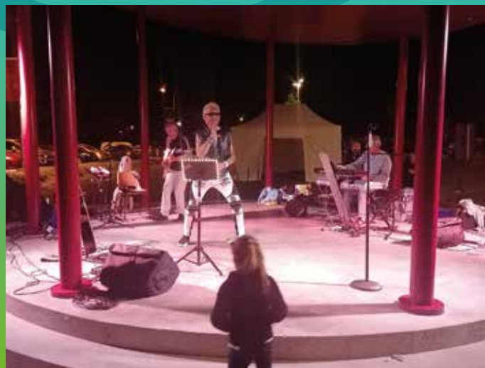
Fête de la musique : le feu a été allumé !

La plupart de ces manifestations se tiennent à la plaine d'accueil sur le kiosque qui devient LE lieu animé pour les habitants et les touristes, de passage le temps d'un repas ou d'un séjour. Cet espace va tout prochainement s'enrichir du bâtiment des comptoirs. Signe de son succès, nous sommes régulièrement sollicités par des artistes ou des troupes qui souhaitent s'y produire.