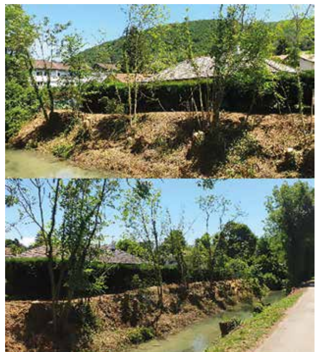
Travaux d'abattage et d'élagage rue de la Fure.

Le SYMBHI gère désormais les berges de la Fure depuis les vannes jusqu'au lieudit la trappe rouge. Suite à une alerte et des plaintes de riverains et en regard des risques, un chantier d'abattage d'arbres (essentiellement des frênes) s'est déroulé début juillet.