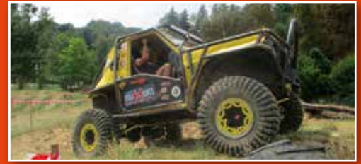
Rando Oxy Jeep 2022.