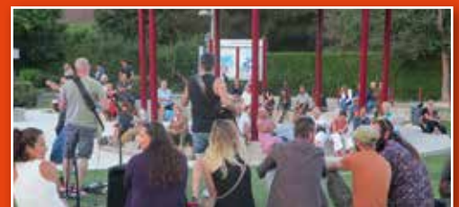
"On branche le kiosque" : succès de l'édition 2022.