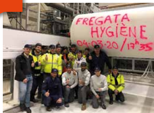
Le 4 mars 2020, redémarrage de la papeterie avec Fregata Hygiène. Pour de nombreux habitants du Guillermet, pas de doute, la nouvelle papeterie génère bien plus de nuisances sonores qu'à l'époque d'Arjowiggins.

La commune a pris en charge une campagne de mesure acoustique afin de disposer de données autres que celles fournies par le bureau d'expertise acoustique missionné par l'entreprise. Les conclusions des deux bureaux d'étude sont contradictoires. Pour le bureau missionné par l'entreprise le niveau sonore actuellement mesuré est conforme à la réglementation. Il ne l'est pas pour le bureau missionné par la commune. Une rencontre est en cours de programmation avec une représentation des riverains, l'entreprise, la commune et la DREAL (Direction Régionale de l'Environnement, l'Aménagement et du Logement). Le contrôle du respect de la réglementation pour les installations classées (telles que la papeterie) est en effet du ressort de l'Etat.