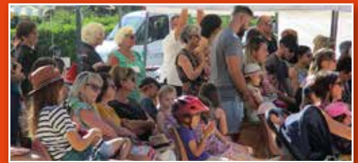
Spectacle de cirque lors de la journée parentalité.