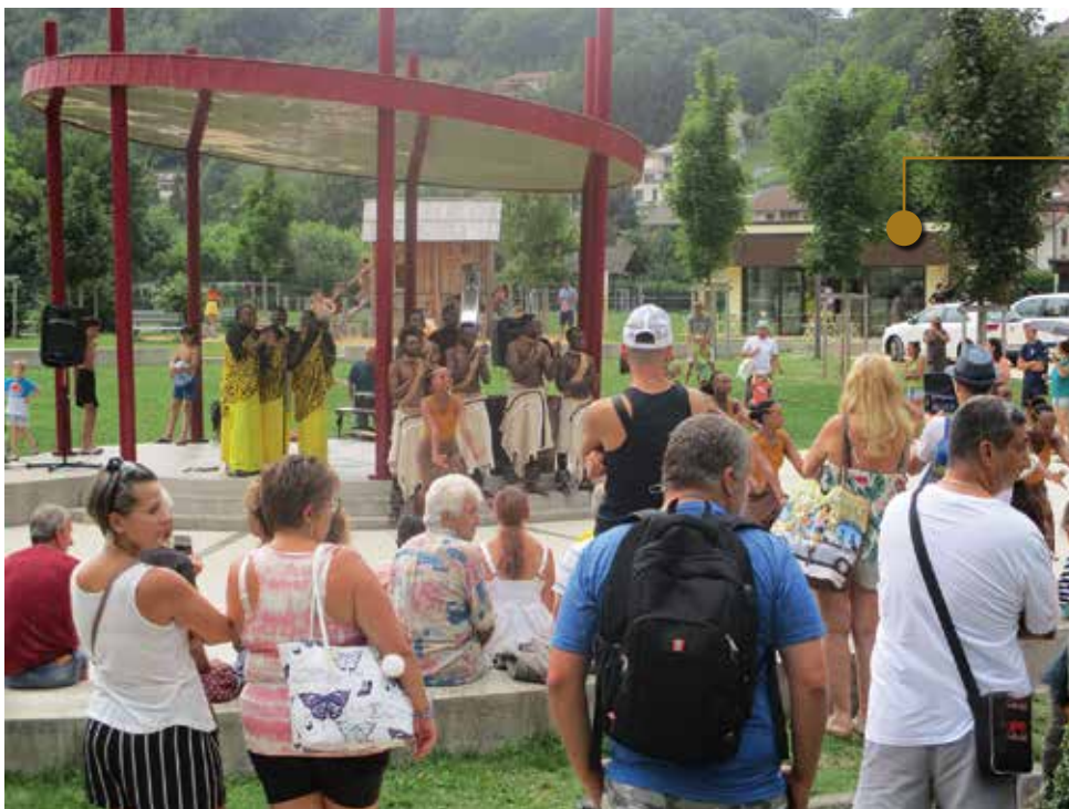
Le kiosque, fenêtre ouverte sur les cultures du monde.