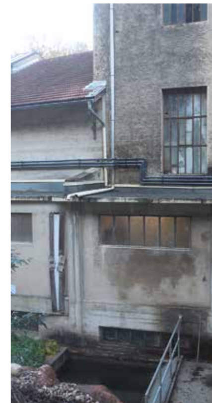
Localisation de la rupture de tuyauterie en surplomb de la zone de captage

De ce point trois tuyaux partent en direction des cuves correspondant aux différents produits, dont celui dédié à la résine, ils sortent et longent à