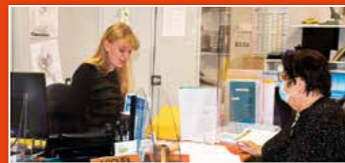
Malgré les circonstances, travail intensif en mairie