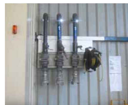
Rampe à laquelle se raccorde le camion citerne pour les livraisons

L'organisation se déroule de la façon suivante : le camion-citerne s'installe au point de dépotage, accessible depuis le quai nord. La citerne est alors raccordée à la rampe de piquage de dépotage.