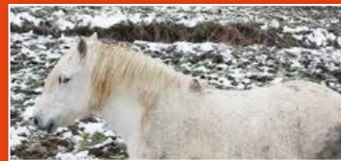
Premiers flocons de la saison sur la campagne charavinoise