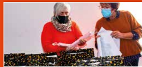
Toute l'équipe du CCAS à la préparation des colis