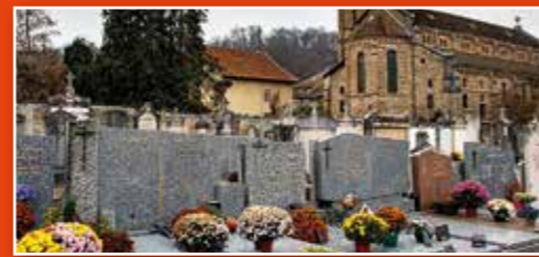
Fleurissement de la Toussaint