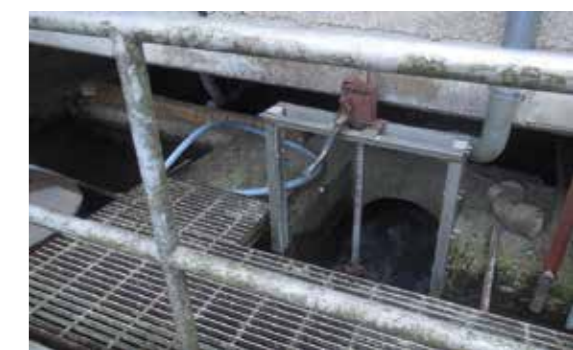
Le trop plein de la zone de captage rejoint la rivière.

l'extérieur les murs de l'usine pour y rentrer à nouveau au droit des cuves, tout cela à l'arrière de l'usine. La tuyauterie s'est démontée au droit d'un coude. Le temps que les agents en charge de l'opération constatent la rupture et cessent les opérations, de 600 à 700 litres de résine se sont déversés dans la zone de captage en contrebas, dont le trop plein rejoint ensuite la rivière.